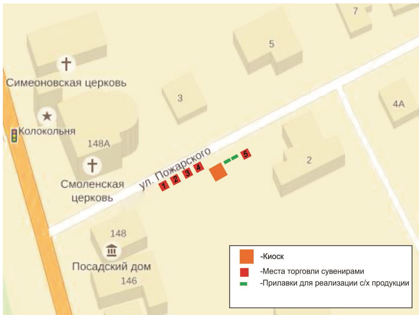
СХЕМА размещения торговых мест на универсальной ярмарке на территории города Суздаля