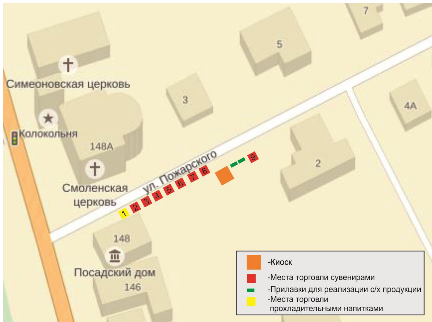
СХЕМА размещения торговых мест на универсальной ярмарке на территории города Суздаля