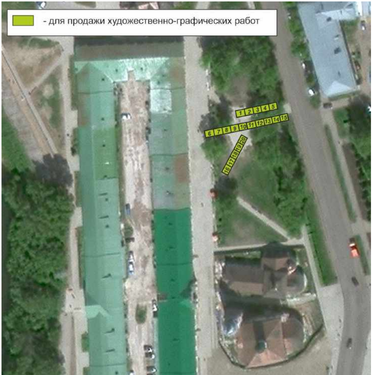
Схема размещения торговых мест на универсальной - Рождественской ярмарке ул. Ленина, земельный участок площадью 2180 кв.м.